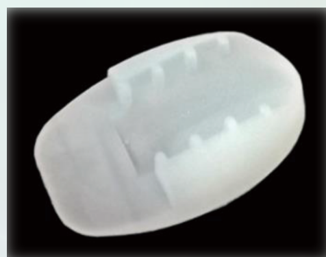
動脈留置針固定パッチ

Cat.No. A N 0 5 Size 幅 2 0 . 0 mm 長さ 3 1 . 5 mm 厚さ 8 . 4 mm 重さ 1 . 8 g 角度 1 2 . 5 ° 材質 シリコンエラストマー