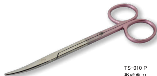
TS-010 P 形成剪刀