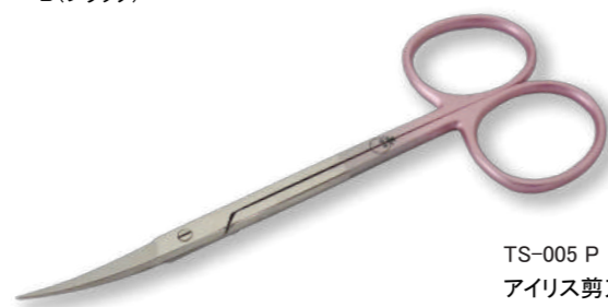
TS-005 P アイリス剪刀 (眼科剪刀)