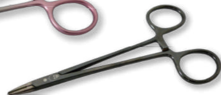
TN-013 B C/Cウェブスター持針器