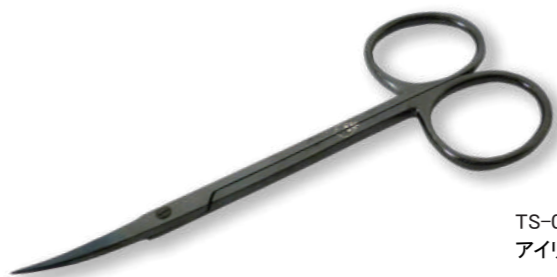
TS-005 B アイリス剪刀 (眼科剪刀)