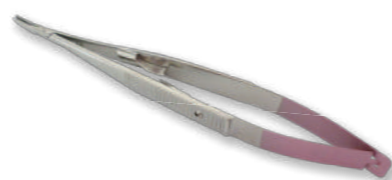
TN-016 P C/Cマイクロ・カストロ持針器