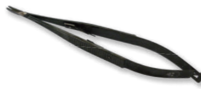
TN-016 B C/Cマイクロ・カストロ持針器