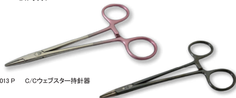
TN-013 P C/Cウェブスター持針器