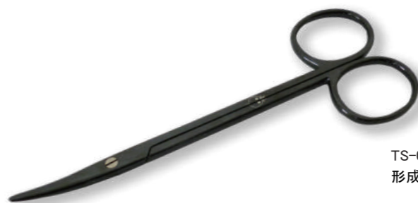
TS-010 B 形成剪刀