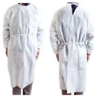
[DG02] アイソレーションガウン