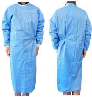
[DG01] サージカルガウン